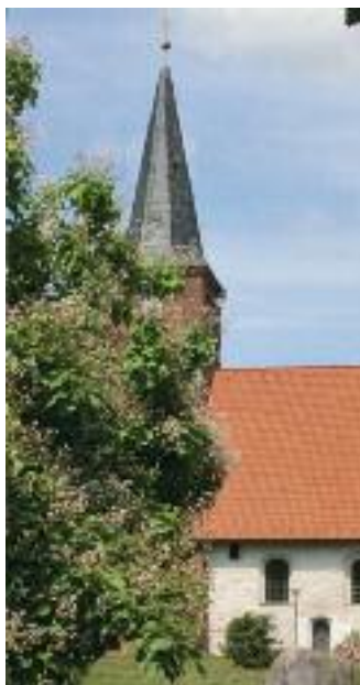
Die Bornhöveder Kirche St. Jacobi

Am Freitag, den 23. August bietet der Touristverein Holsteinseen e.V. zusammen mit der Evangelisch-Lutherische Kirchengemeinde Bornhöved und mit fit & fröhlich kostenlose Veranstaltungen für Gäste und Einwohner an: Um 15 Uhr findet unter der Leitung von Frau Pastorin U. Egner eine Führung in der Vicelin-Kirche St. Jacobi von 1149 in Bornhöved statt. Die Bornhöveder Kirche St. Jacobi wurde im Jahr 1149 durch den Oldenburger Bischof Vizelin geweiht. Sie war ursprünglich eine Wehrkirche, da Bornhöved im Grenzbereich zwischen Holsten und dem Gebiet der Wenden lag. Auch in diesem Jahr stellt die Deutsche Stiftung Denkmalschutz wieder 25.000 Euro zur Sanierung der Kirche zur Verfügung. Ab 19 Uhr bietet eine professionelle Trainerin von fit & fröhlich Yoga an der Badestelle Wankendorf am Schierensee an. Vermittelt werden Körper- und Atemübungen, Meditationstechniken und positives Denken von Anfang an.