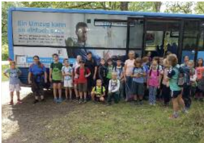
Erschöpfte aber glückliche Kinder vor der Rückfahrt vom Kletterpark.