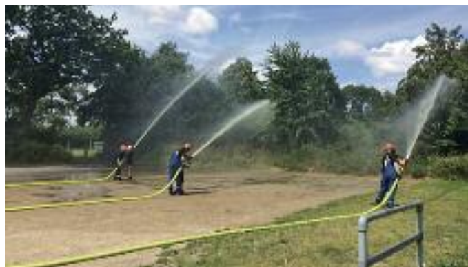
Ferienpassaktion : Lust auf Jugendfeuerwehr

Jugendfeuerwehr Wankendorf www.Jugendfeuerwehr-Wankendorf.de