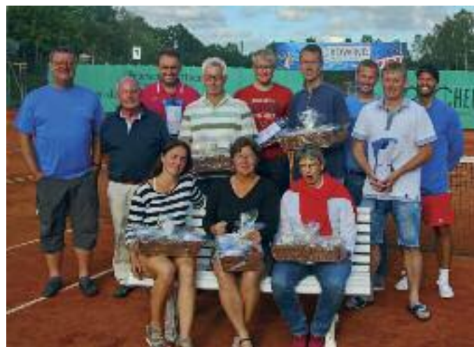
Alle Titelträger des Nordwind-Cups 2018 auf einem Blick

Mit sportlichem Gruß Rüdiger Heisch - Pressewart - TC Wankendorf