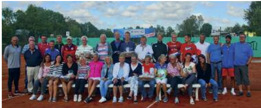
Alle Sieger und Platzierten aller Konkurrenzen beim diesjährigen 18. TCW-/Nordwind-Cup 2018