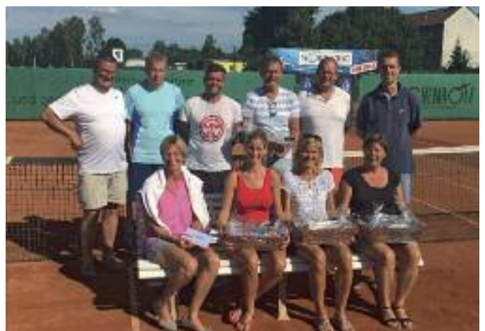
Alle Titelträger des Nordwind-Cups 2018 auf einem Blick

Mit sportlichem Gruß Rüdiger Heisch TC Wankendorf - Pressewart -