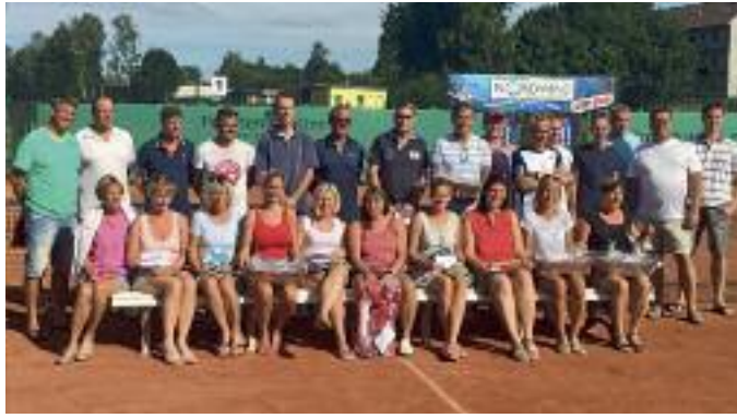
Alle Sieger und Platzierten aller Konkurrenzen beim diesjährigen 18. TCW-/Nordwind-Cup 2018