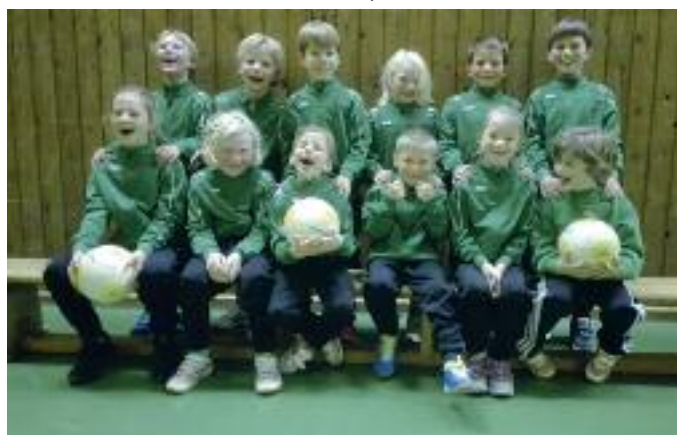
Unsere F-Jugend bedankt sich bei der Altherren-Mannschaft des SVB für die neuen Trainingsanzüge.

wir uns gegen den FC Krogaspe mit 0:2 geschlagen geben. Das Spiel um Platz 3 bestritten wir gegen den Gastgeber PSV NMS, welches wir nach einem spannenden Spiel und einem 9m-Schießen mit 2:1 gewinnen konnten. Aufgrund einer geschlossenen guten Mannschaftsleistung mit viel Einsatzwillen und Spielfreude, war es ein überraschender, aber auch verdienter 3. Platz. Bei allen war die Freude riesengroß! Spende