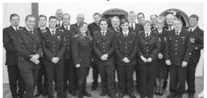
Gewählte, beförderte und geehrte der FF Wankendorf

2018 wirft seine Schatten voraus: So wird in Kürze die Indienststellung eines Einsatzleitwagens für die Löschgruppen und eines Mannschaftstransporters für die Jugendabteilung erwartet. Außerdem feiert der Kreisfeuerwehrverband Plön sein 125jähriges Bestehen. Das Festprogramm beinhaltet unter anderem ein Feuerwehrikonzert mit dem Blasorchester in Wankendorf. Die nächsten Termine: 07. Februar: Dienst Aktive, Beginn 19.30 Uhr Feuerwehrhaus 16. Februar: Skat und Knobeln für Mitglieder der Einsatz-, Reserve- und Ehrenabteilung, Beginn 19.30 Uhr Feuerwehrhaus 21. Februar: Dienst Aktive, Beginn 19.30 Uhr Feuerwehrhaus