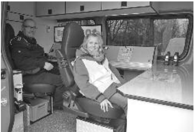
Der Einsatzleitwagen (ELW1) ist seit dem 20.03.2018 im Fuhrpark der Freiwilligen Feuerwehr in Wankendorf.

Am Mittwoch dem 21.03.2018 besuchten die dritten Klassen mit ihren Klassenlehrkräften die Freiwillige Feuerwehr in Wankendorf. Dort wurden die Kinder in drei Gruppen aufgeteilt. Die erste Gruppe sah sich zunächst das Löschgruppenfahrzeug mit den Geräten an. Die zweite Gruppe erfuhr, welche Ausrüstung die Feuerwehrleute schützen. Danach ging es in einen Raum mit künstlich erstelltem Rauch, um die Wärmebildkamera auszuprobieren. Die dritte Gruppe übte fleißig den Notruf mit den fünf „W“-Fragen abzusetzen. Am Ende des Vormittages hatten alle Kinder die drei Stationen absolviert. Ein großer Dank geht an die Feuerwehrkameradin/Feuerwehrkameraden, die sich für uns Zeit genommen und den Vormittag so interessant, aufschlussreich und informativ gestaltet haben. Kinder können ab 10 Jahren bei der Freiwilligen Feuerwehr in Wankendorf immer freitags von 18.00 bis 20.00 Uhr (außer in den Ferien) mitmachen. Einen Termin für das Kennenlernen sollte vorab vereinbart werden.