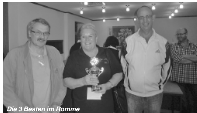
Die 3 Besten im Rommé