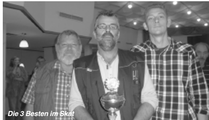
Die 3 Besten im Skat